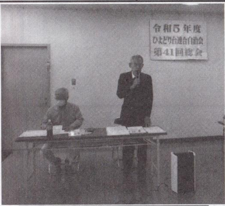
開会の挨拶をする南連合会長

7団地から「7団地と西市住との間の市道を特定のトラックが通行する時の振動が激しい、なんとかしてほしい」 4団地から「西市住側の歩道が、ガタガタです、つまずいて転倒される人もいる、私は毎日散歩している