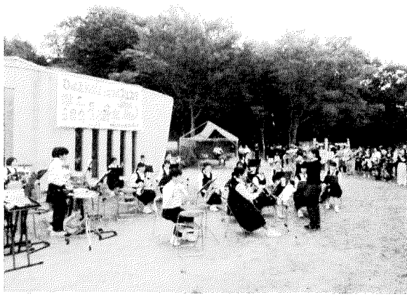
鴨中吹奏楽部の演奏で幕開き。