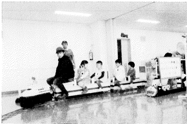
「ミニ鉄道」の乗車走行会場（会館2階）