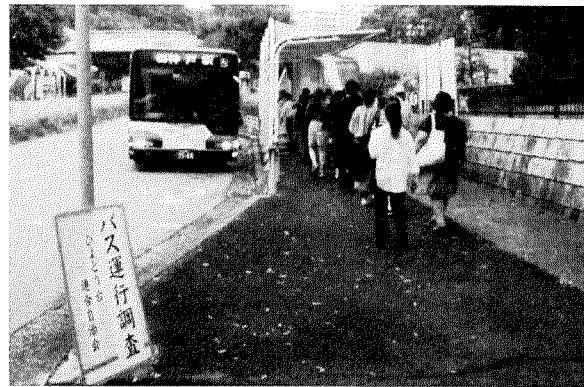
市バス運行調査中(センター前バス停)

連合自治会は住民の足となっている路線バスの運行実態調査を10月2日(水)ひよどり台各停留所と星和台南口の4ヶ所で、始発から午前10時までで行い通勤・通学などのバス利用人数と運行状況を見分しました。今回の調査で次のよう な結果を得た。 ①神戸駅行きの10時までの乗客数は昨年より14人増加したが一昨年より62人減少した。 ②三ノ宮行きの乗客数はここ数年は大きな変動はなかったが、今回では