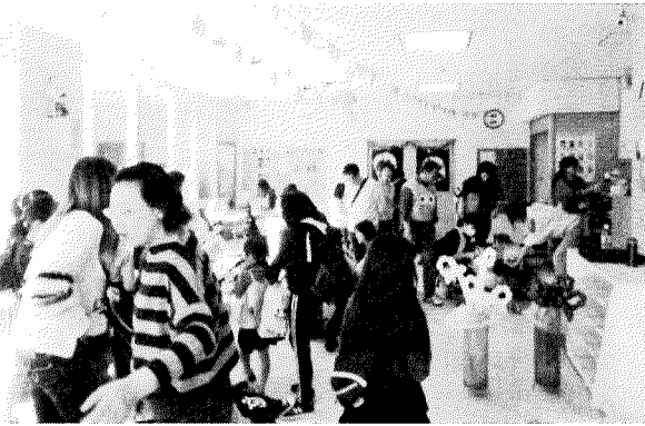
児童館もハローウィンで盛り上がり