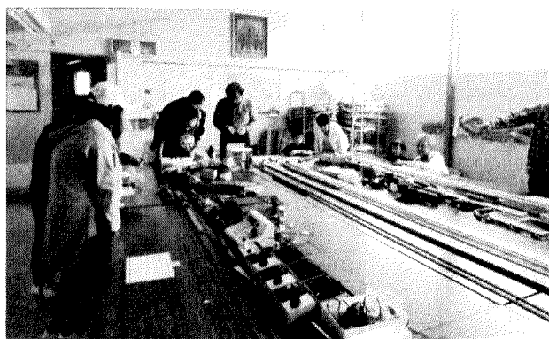
模型電車の走行と展示（川重鉄道研究会）