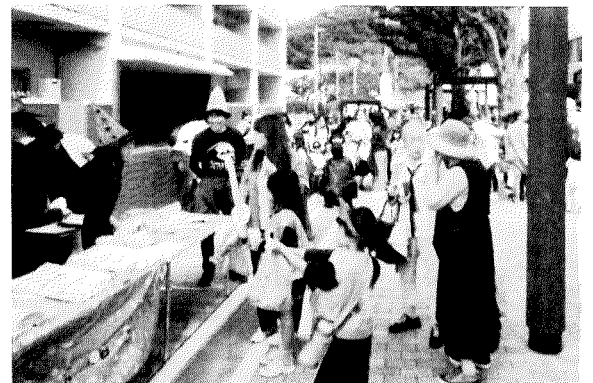
ひよぼっく通りは大賑わいです