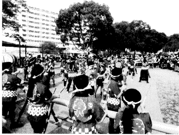
ひよどり台小学生の太鼓演奏