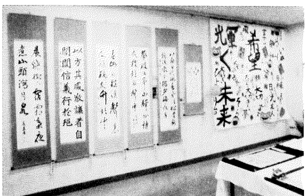
ひよどり台会館では地域の方々の作品が多く展示されました。