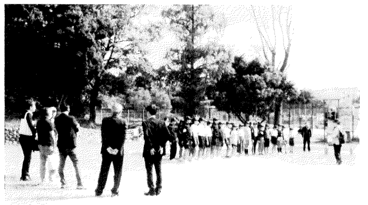
防コミJCを激励する北区長一行