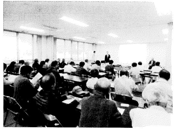
前夜祭の出前トークには多くの人達が