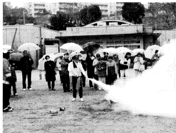
粉末消火器を使つての消火訓練

訓練当日は寒さ厳しく小雨の天候にも関わらず、ひよどり台全体約百五十名の方が訓練に参加、また今回の訓練でいろいろなデータ・教訓等を得た。この訓練は毎年各丁目ブロック持ち回りで実施している。