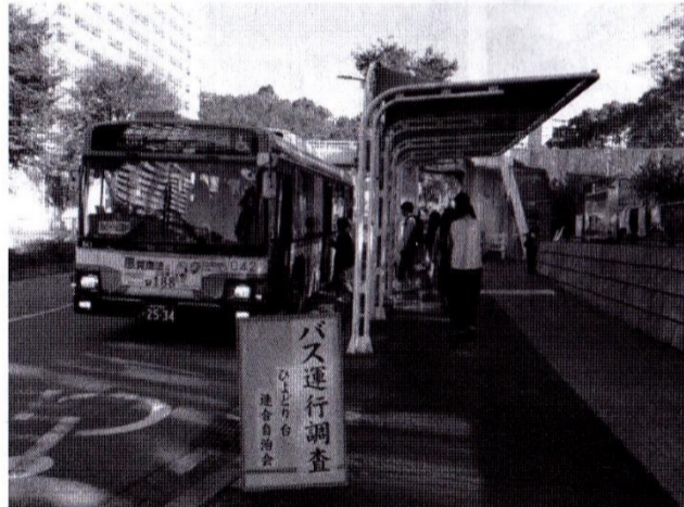
市バス運行調査中(センター前バス停)

ワイワイフェスタ開催 連合自治会主催第20回ひよどり台ワイワイフェスタを10月21日(日)に開催しました。 各地の担当役員が前日早朝から資材の搬入をして会場設営に汗を流し、当日も早朝から準備と催し物の