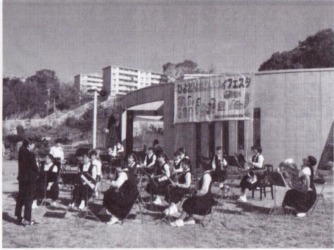
鶴中吹奏楽部の演奏で幕開き。