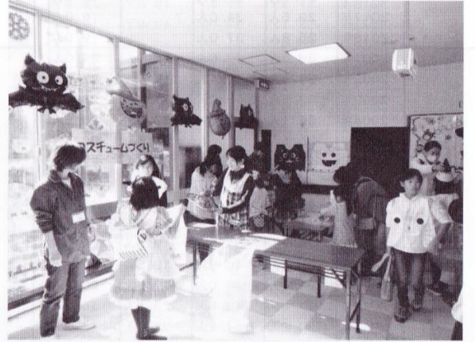
児童館もハローウィンで盛り上がり