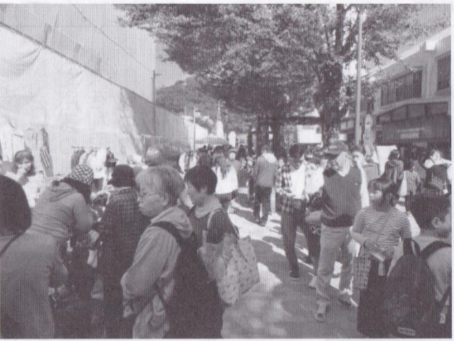
ひよぼっく通りは大賑わいです