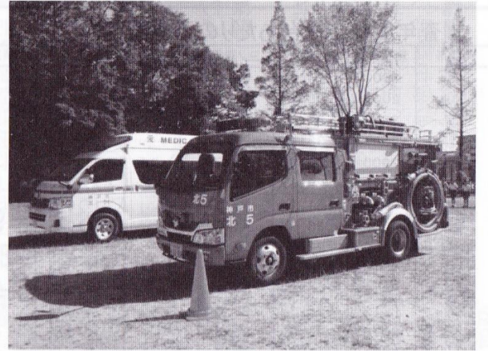
消防車と救急車の展示見学