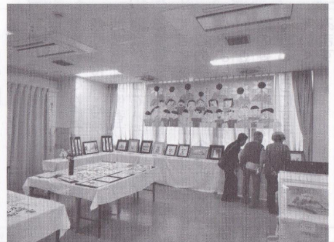
ひよどり台会館では地域の方々の作品が多く展示されました。