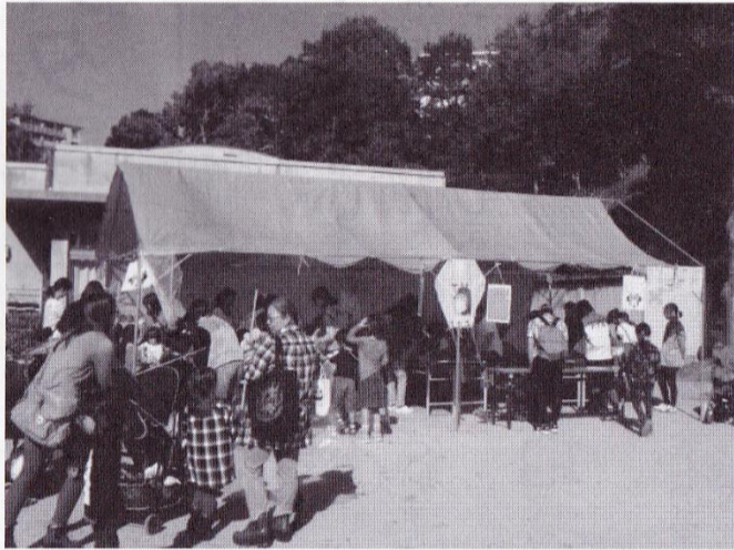
凧作り・凧揚げ（小学PTAさん）