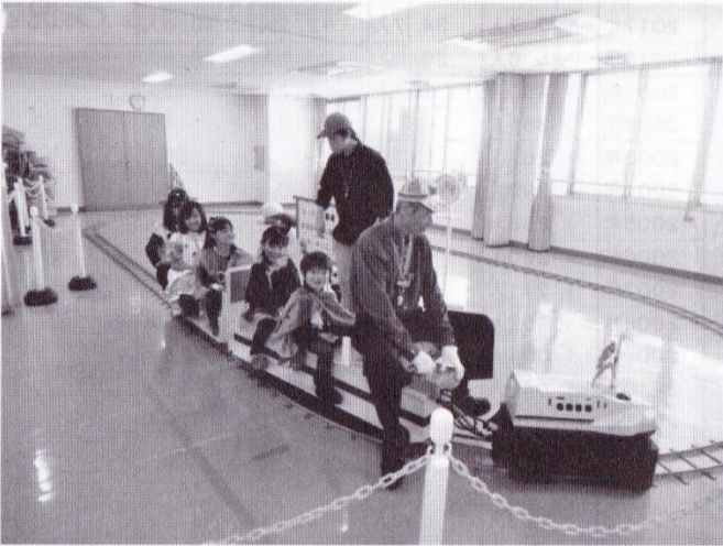
「ミニ鉄道」の乗車走行会場（会館2階）