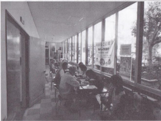
真剣に健康相談を