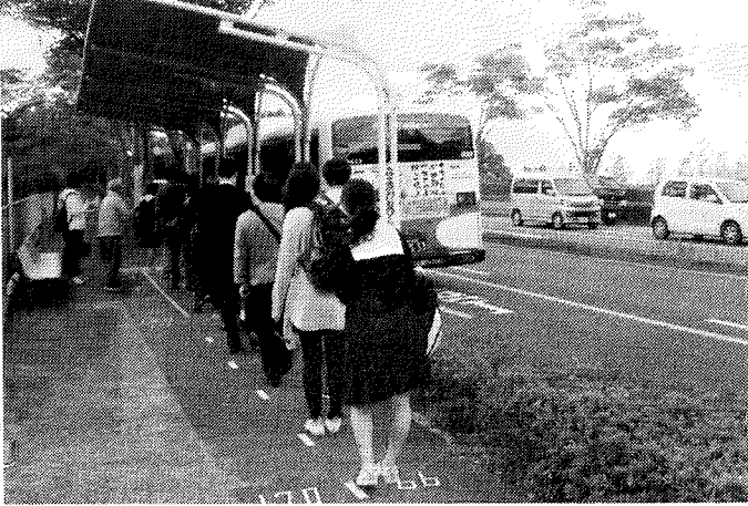
市バス運行調査中(星和台南バス停)

利用者の減少がないように皆でバスを利用しましょう。利用者の減少が続くと当局の減便施策を招く恐れがあります。