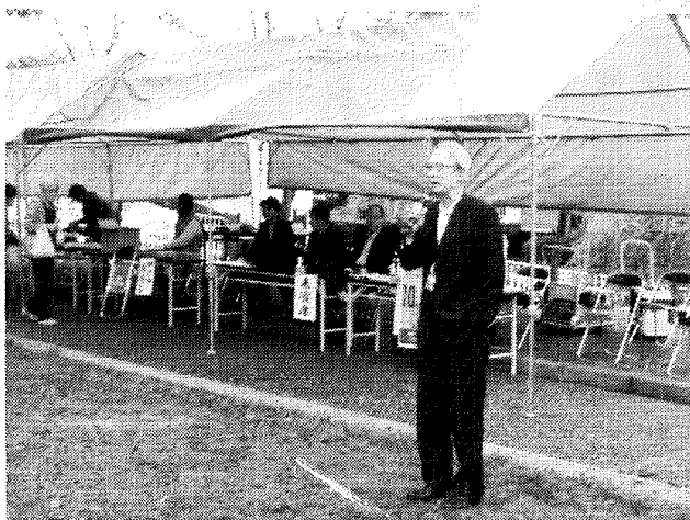
開会の挨拶をする連合自治会々長。