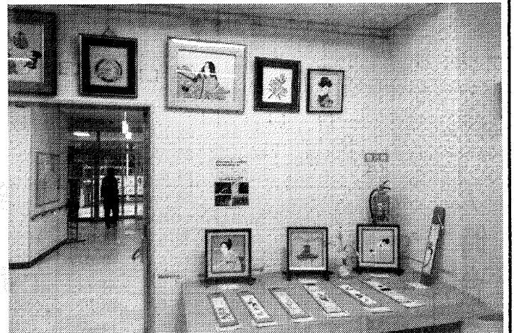
ひよどり台会館では地域の方々の作品が多く展示されました。