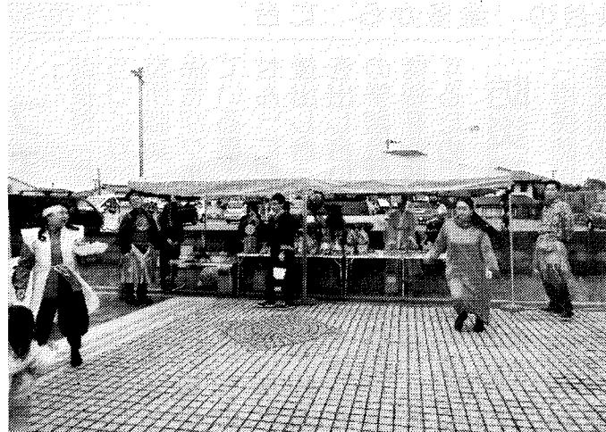
ひよぼっく通り（商店街）では多くの方々が楽しんでいました。