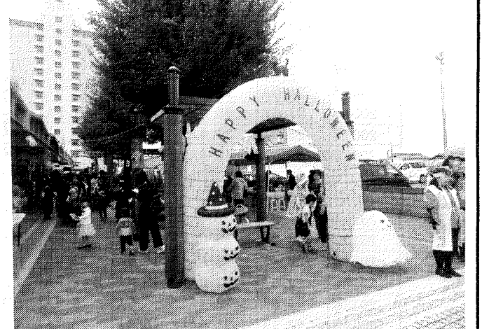
ひよぼっく通りは大賑わいです