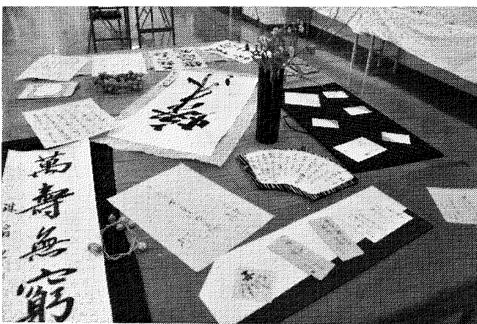
ひよどり台会館では地域の方々の作品が多く展示されました。