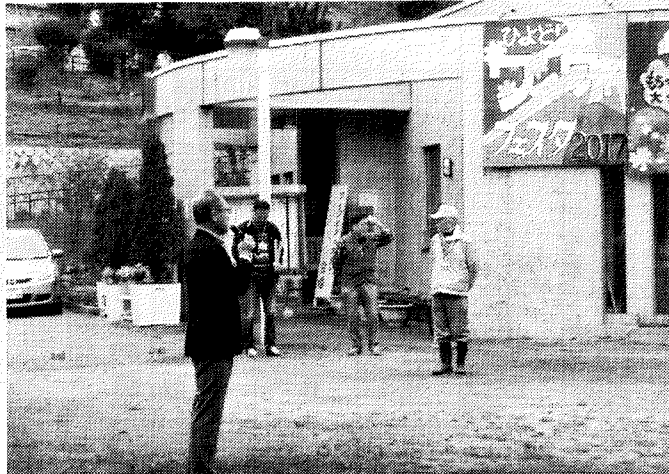
開催祝辞を述べる来賓代表