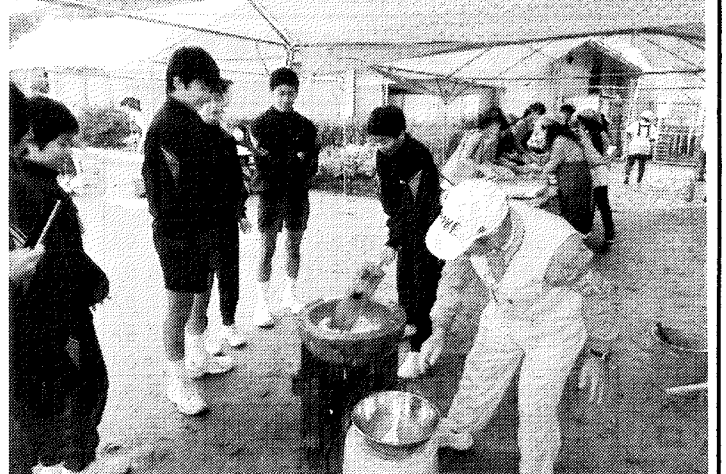
お餅を搗くボランティアの鴨中生