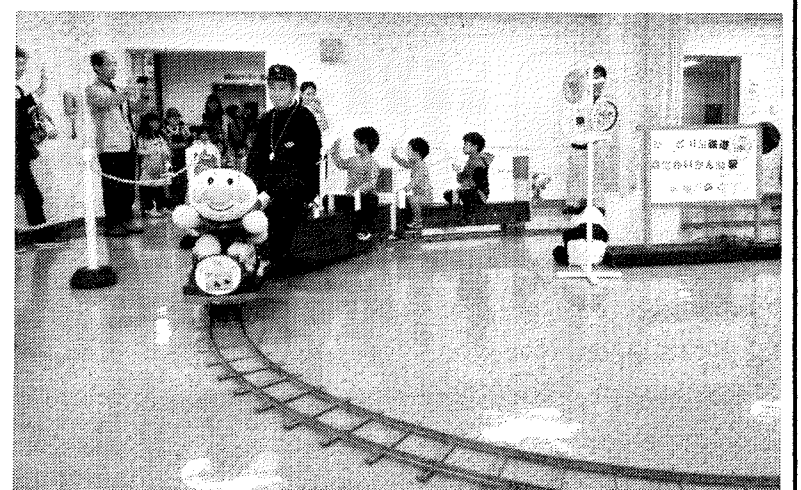
「ミニ鉄道」の乗車走行会場（会館2階）