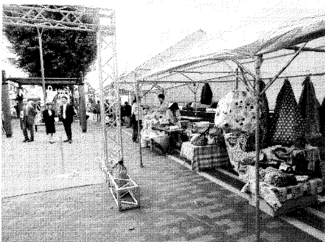
フリーマーケットも沢山出店