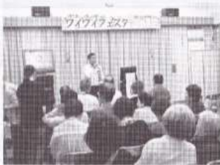
振り込め詐欺の注意を呼びかける北警察署