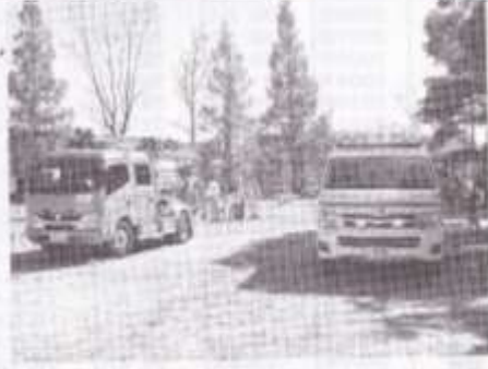
救急車と消防車も参加しました。