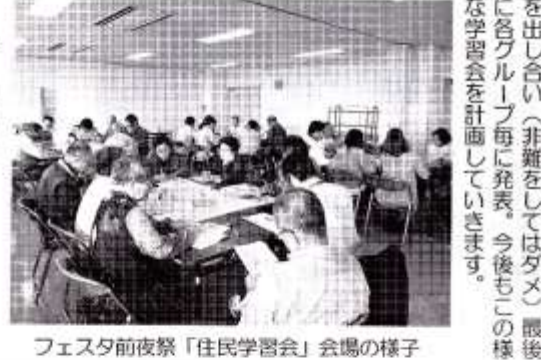
フェスタ前夜祭「住民学習会」会場の様子

フェスタ前夜祭 今年も数年前に前夜祭「住民学習会」を開催した。住民学習会では各団地役員・役所職員・小学校関係者・地域福祉関係者等43名が出席した。学習会では五つのグループに分かれ、各グループ内では各自から困っている事・問題になっている事を「ふせん」に記入してボードに張り付ける、その後ふせんの内容について自由に意見