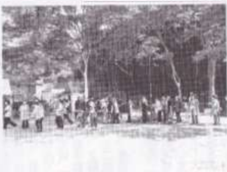
餅つき会場は長い行列ができました。