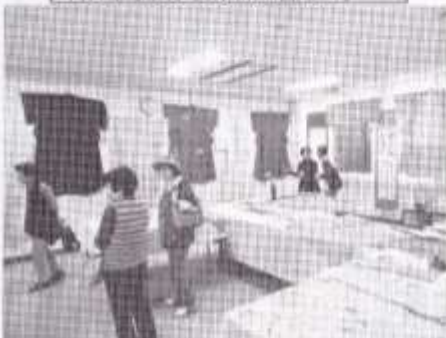
ひよどり台会館では保育所・幼稚園の園児の作品や地域の方々の作品が多く展示されました。