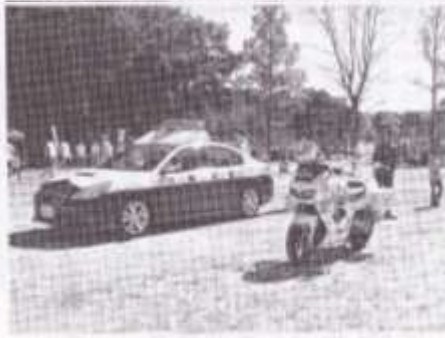
パトカー・白バイに乗って記念撮影。