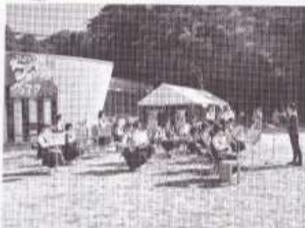
鴨台中学校吹奏楽部の皆さん。