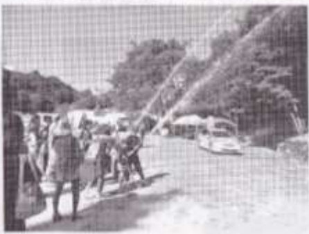
防災訓練での放水体験