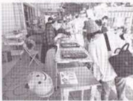
ひよぼっく通り（商店街）では多くの方々が楽しんでいました。