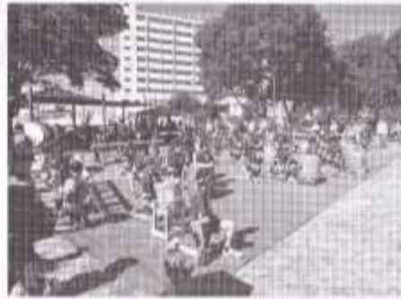
ひよどり台小学生の「太鼓演奏」