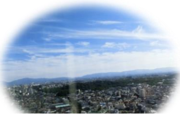
堺市役所展望ロビーより