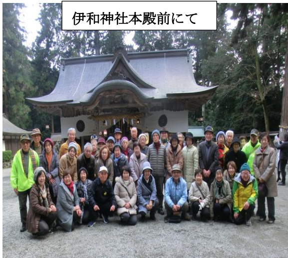
伊和神社本殿前にて

中国道で加西SAで集結(休憩)各号車毎に分散 して帰路に、我が3号車は無事にひよどり台 に到着しました、皆様お疲れ様でした。 皆様方のお多幸とお健康を祈願します。