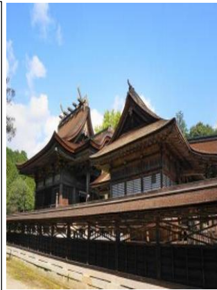
入母屋造妻入(本殿) 国の重要文化財指定

昼食は《西の屋 赤坂店》でのお食事と(ピ ールも)とお買い物!後は美作国の一宮であ ります 中山神社 に向けバスは走る。 本殿が「中山造」と言う構造で珍しい様式。