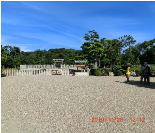
仁徳天皇陵古墳拝所