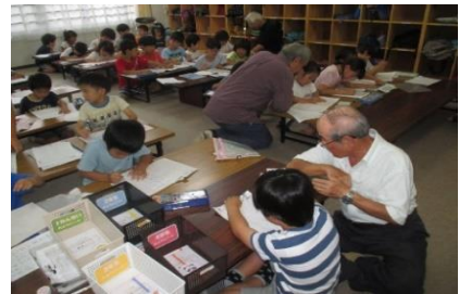
児童館夏休み宿題支援

7月22日(月)～7月25日(木)の4日間、ひよどり台 クラブ員12名(延べ24名)が、夏休み宿題支援に参加 しました。大勢の子供たちが夏休みの課題に挑戦する 姿に、会員も元気をもらいました。