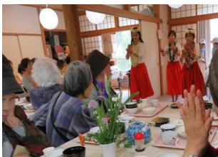
ハワイアンダンス観賞