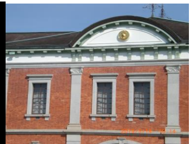
幹部候補生学校庁舎

昭和35年から構内見学開始年間約75万人来訪他に様々な歴史的建築物・教育施設が多数有る