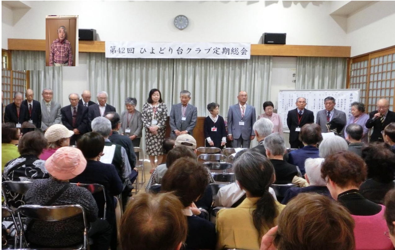
第42回ひよどり台クラブ定期総会を盛大に開催

平成最後の年4月21日(日) 最近の異常天候の中いささか穏やかな日和の今日クラブ第42回定期総会が福祉センターで満員の会員をお迎えして開催されました