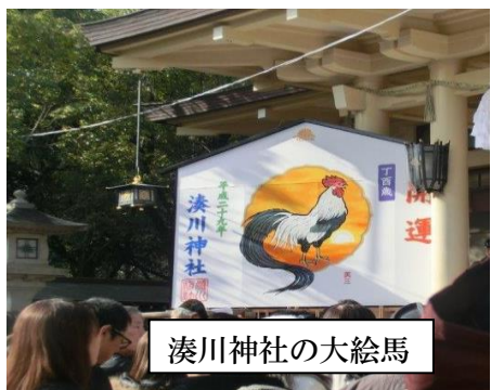
湊川神社の大絵馬