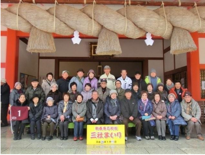
1号車の皆様 出雲大社巖分祠にて

日本海側の降水確率50%が信じられないような晴天：順調なバスの旅が始まりましたが、綾部を過ぎるあたりから雲行きが怪しくなり美しい神殿の出雲大社巖分祠に着く頃は、傘の出番となりました。大国主大神をお祀りする神殿では二拝四拍手一拝。