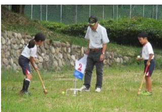
慎重に↑↓表彰式の後で