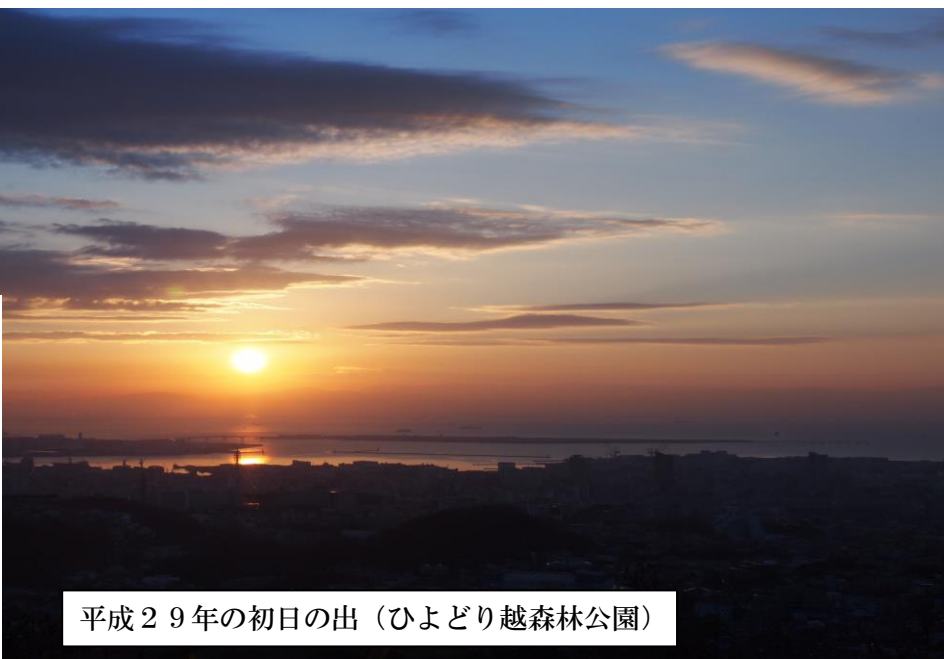
平成29年の初日の出 (ひよどり越森林公園)