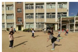
羽子板↑↓始めの言葉