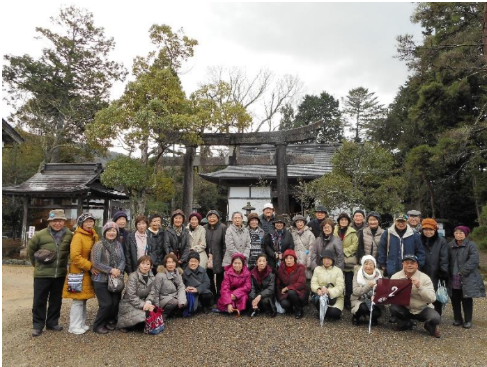
2号車の皆様 浦嶋神社にて