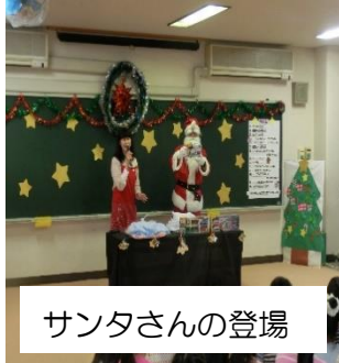
サンタさんの登場