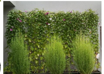
地域福祉センター前のアサガオカーテン