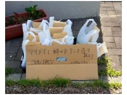
5月 地域福祉センターと交流プラザ前にアサガオの苗 20人分を置き頒布