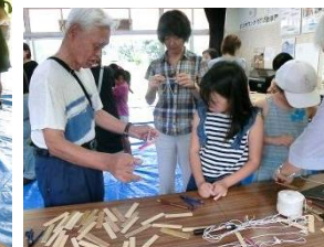
ほら、こうして回そう