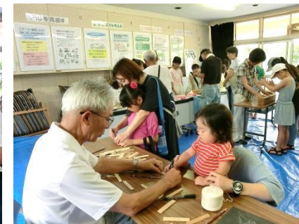
ぶんぶんゴマ一緒に作ろうね