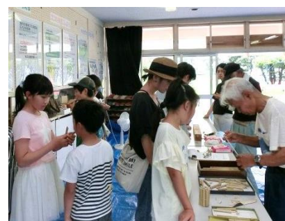
この笛、いい音がでるかな