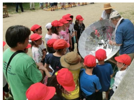
ソーラークッカーで目玉焼ができた!

梅雨の合間の好天に恵まれラッキー。10・20ワイワイフェスタでもクッカーの実演を予定。