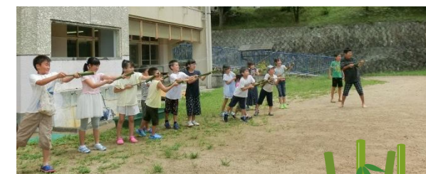
どこまで飛ばせるか、水鉄砲