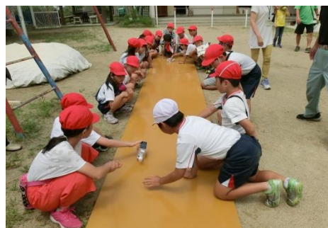
走るぞ！早い!! ソーラーカー

小学生79名が4つのコーナーで太陽のパワーを体験しました。光と熱のエネルギーはすごい!!