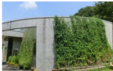
↑アサガオ & ゴーヤ 福祉センターの窓が隠れました

今年も神戸市から「緑のカーテン」設置の呼びかけがありました。食べてよし、見て涼しいゴーヤや、アサガオのカーテン、来年はお宅にもぜひ。