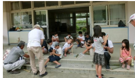
よく飛ぶ水鉄砲を作ろう