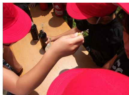
黒白のペットボトルで温度が違う?