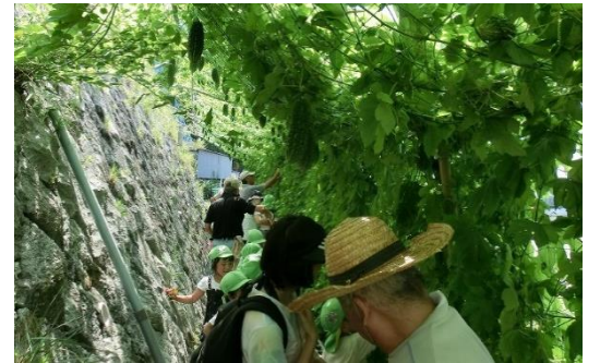
8/9 葉っぱの下は涼しいね～

交流プラザのエコ農園には保育所や児童館の子供たちが訪れ、ゴーヤの収穫や、ジュースを楽しみました。