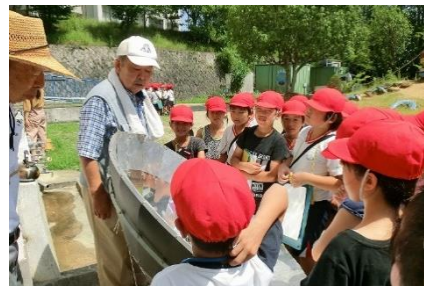
ソーラークッカーで目玉焼きができた！ 黒と白のペットボトルの水、どちらが熱い？