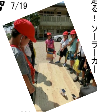
走る！ソーラーカー