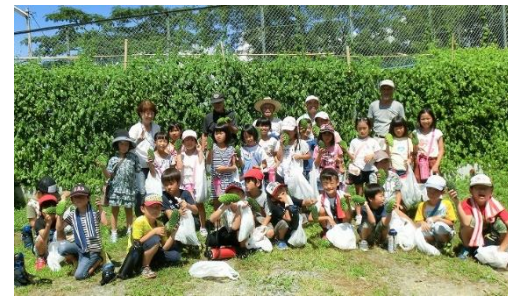
8/4 交流プラザのゴーヤ回廊にて

交流プラザのエコ農園には保育所や児童館の子供たちが訪れ、ゴーヤの収穫や、ジュースを楽しみました。