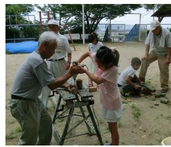
ドリルで穴あけに挑戦