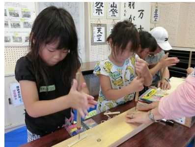
キリで穴あけ 初めてのぶんぶんゴマ作り ～竹は毎年再生するエコ素材！ 放置林も多い昨今、大いに活用しましょう～