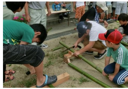
水鉄砲の長さはこれぐらい？