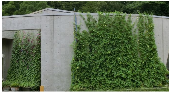
アサガオ 地域福祉センターの窓がすっぽり隠れました

今年も神戸市から「緑のカーテン」設置の呼びかけがありました。 食べてよし、見てよしのゴーヤや、アサガオのカーテン、お宅にもぜひ。