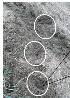
畑に小動物の足跡が！

せっかく種まきした畝をアライグマ(?)が荒らしたみたいだ！ 獣害対策はどうしたら？