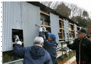
作業の腕前は玄人なみ