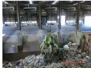
持ち込まれたごみをクレーンで挟み、破碎機にかけます

「大型ごみ」、「燃えないごみ」などを破碎して、リサイクルできるものや燃えるものを取り出してから埋立てる事で、埋立て処分地を長く使えるようにしています。破碎した不燃ごみはブルドーザーで平らにして (3m厚さ) 土を (0.3～0.5m) かぶせる、サンドイッチ工法で埋立てています。