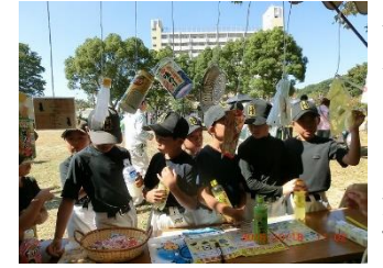
分別クイズに挑戦中

連合自治会主催のワイワイフェスタに今年も参加。恒例のEMボカシ、EM肥料、EM活性液頒布のほか、ミミズによる生ゴミ減量の実際、また分別クイズにも興味を持ってもらいました。