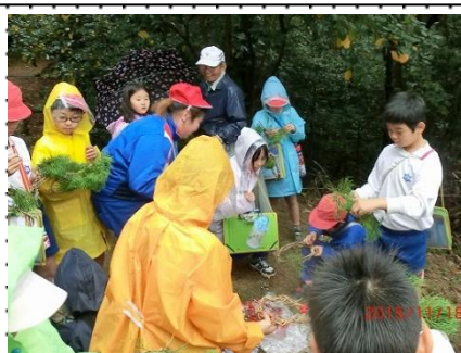
公園のツルを使ってリース作り