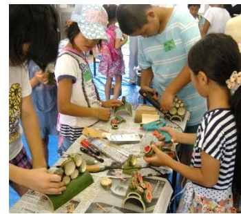
竹カエル作りに奮闘中