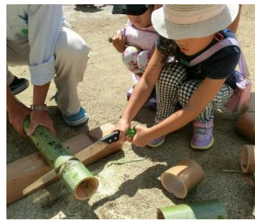
竹ぽっくりの竹伐り