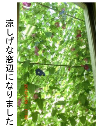
涼しげな窓辺になりました

3月号のエコタウンだよりで、昨年小学生が収穫したアサガオの種をお分けします、とお知らせしたところ、多くの方に持ち帰っていただき、緑のカーテンがあちこちで育ちました。9月に入って、続々と種が交流プラザに届いています。また来年この輪がさらに広がることを願います。