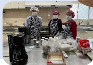
連合自治会会長の交代 新 中野会長へ